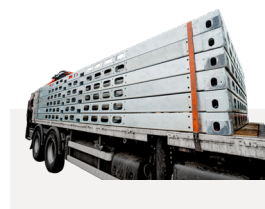
Facile à empiler pour le transport