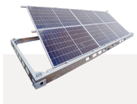
Facile à placer sur une surface plane