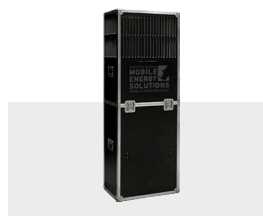
Caisson de soufflage