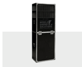
Caisson de soufflage