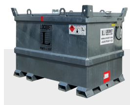
Cuve à carburant externe