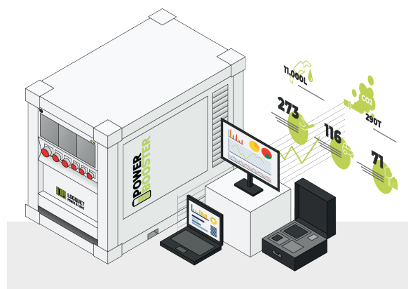
Monitoring | équipé d'un outil complet de suivi et de gestion à distance

Les pointes de puissance demandées par le démarrage du moteur de levage de la grue sont absorbées par les batteries.