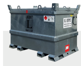
Cuve à carburant externe