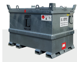
Cuve à carburant externe