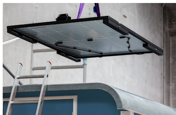
Panneau solaire Wattsun Solarkit