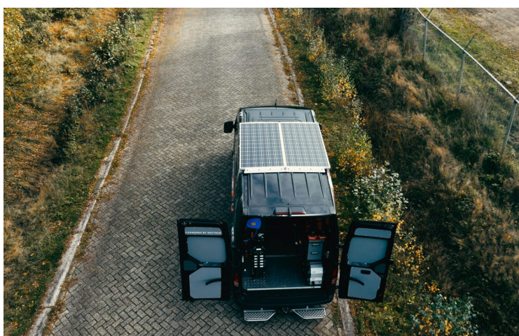
Code : WATTSUN SOLARKIT