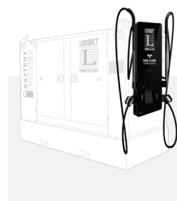
Battery Pack 90/170 met DC Charger 50